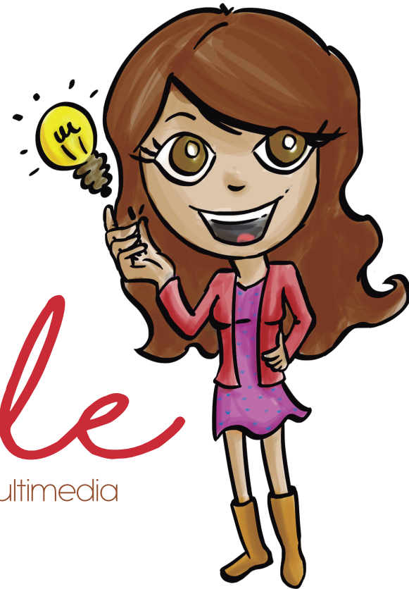
Ilustración • Branding • Multimedia

Este imago tipo está conformado por la marca escrita en letra cursiva y manuscrita, la cual simula el estilo de ilustración naif y desenfadado de la Diseñadora.